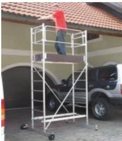
Symbolfoto: Leitern J.Steiner

Gerüsthöhe: 6,50 m, Breite: 2,50 m, Tiefe: 60 cm