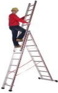
Symbolfoto: Leitern J. Steiner

STEH-und SCHIEBELEITER - Stehend 3 Meter, Ausschub bis 5 Meter